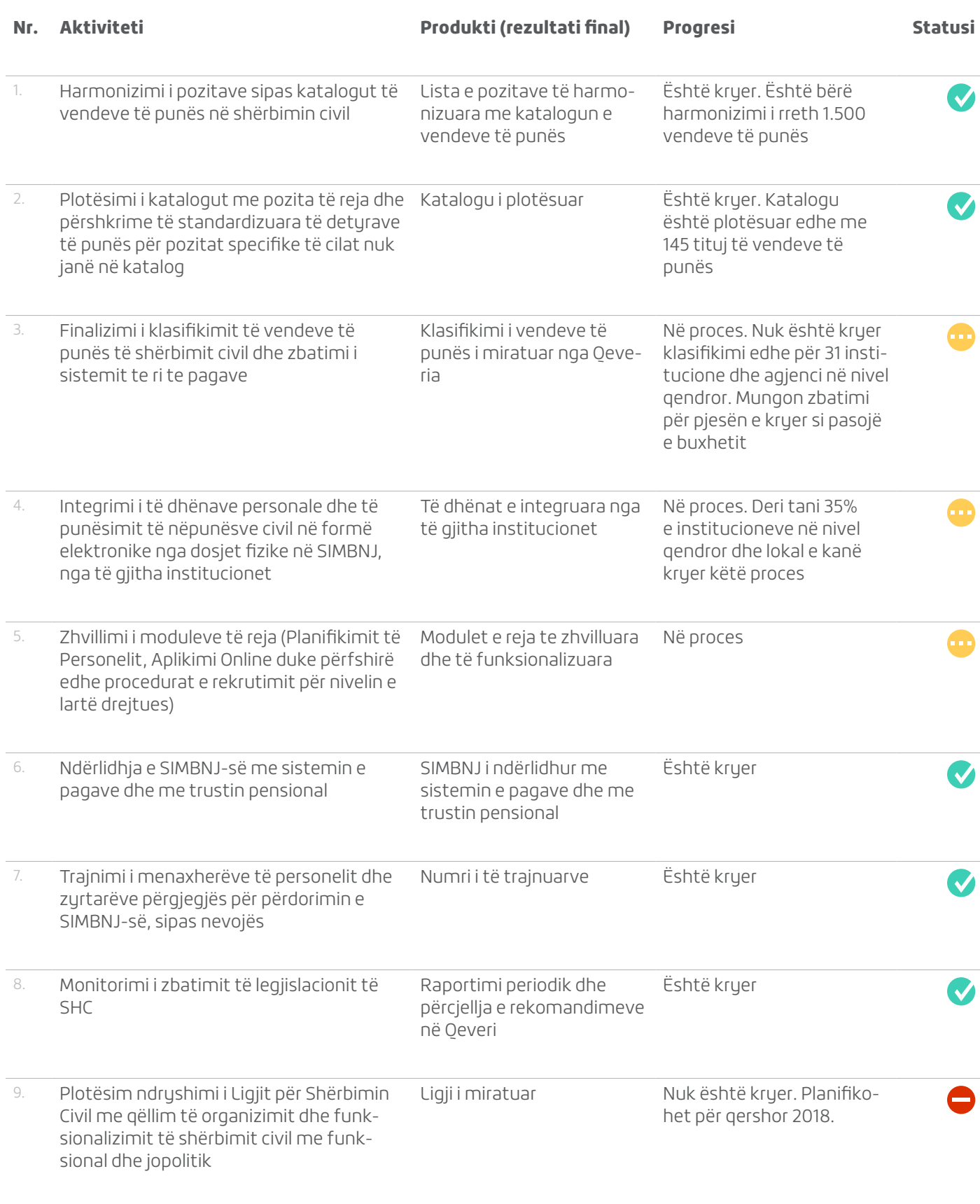
Tabela 2: Aktivitetet e parapara të ndërmerren dhe progresi i arritur: