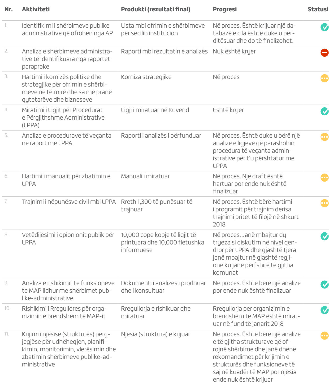
Tabela 3: Aktivitetet e parapara të ndërmerren dhe progresi i arritur: