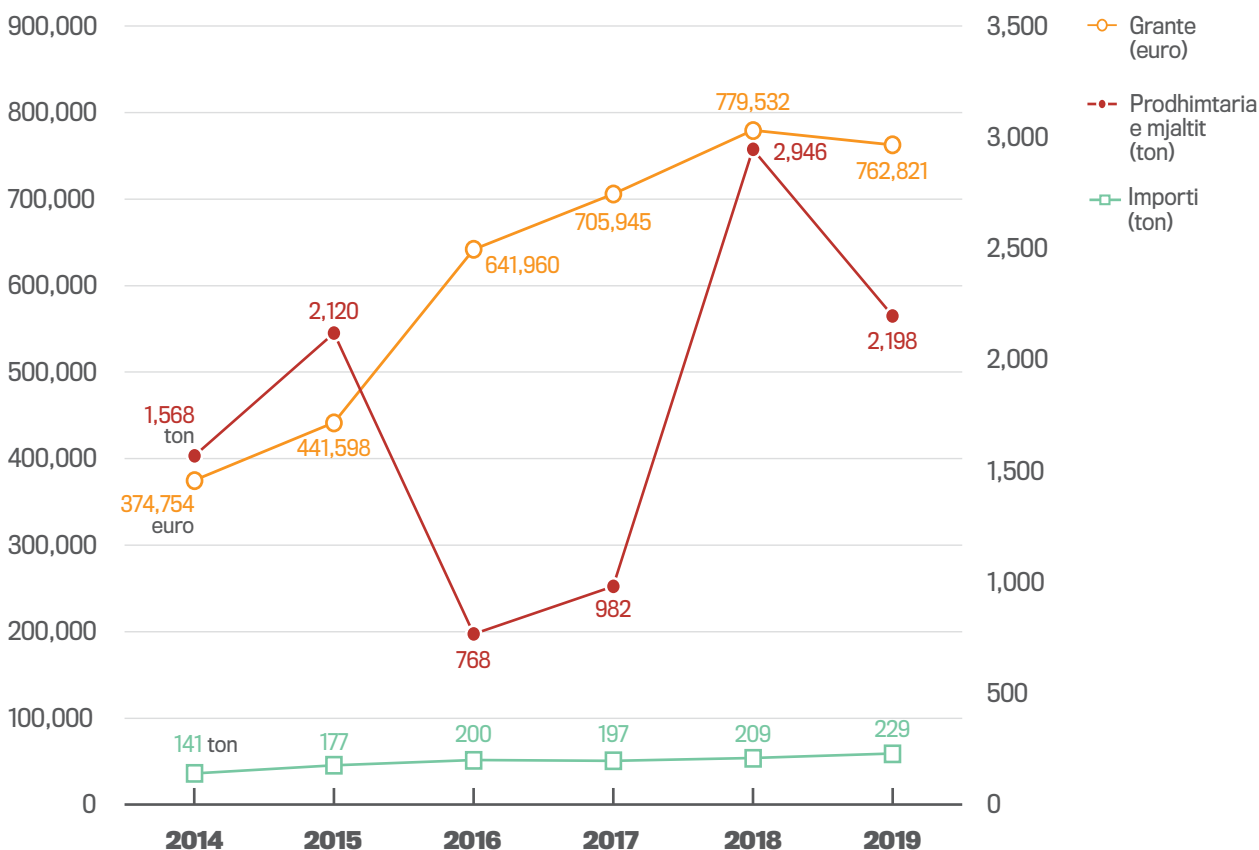
Figura 3. Indikatorët e performancës së granteve për sektorin e prodhimit dhe përpunimit të mjaltit