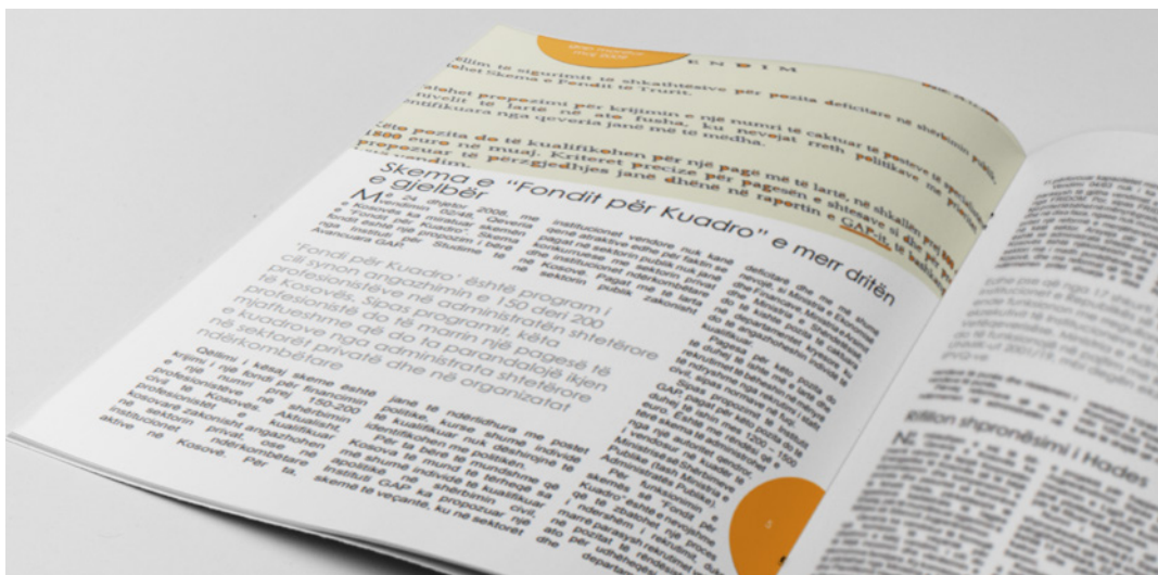
Foto 1. Lajmi i publikuar në GAP Monitor, maj 2009, pas vendimit të Qeverisë për aprovimin e "Fondit për Kuadro"

Prandaj, përmes këtij fondi i cili më vonë mori emrin si "Fondi për Kuadro", do të krijoheshin disa pozita të reja për specialistët e nivelit të lartë të cilët do të paguheshin nga 800 deri në 1,800 euro në muaj, varësisht nga pozita. 10 Fillimisht, u krijuan tetë pozita të reja për të cilat u nda një buxhet prej 41,375 euro, dhe me kalimin e viteve, numri i pozitave dhe buxheti shkoi duke u rritur, ku deri në vitin 2014, ky fond kishte 222 persona që përfitonin prej tij dhe buxheti në dispozicion kishte kapur vlerën prej një milion eurove. 11